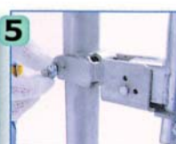
ボルトを手で軽く締めます。

固定金具はワンタッチで建わくに装着できます。しかも、手締めボルトにより、安全を高めるロックが可能です。