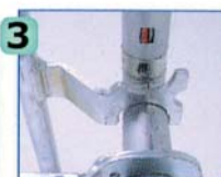
位置決め金具を建わくの横架材にかけます。