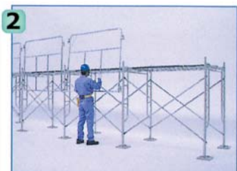
足場外側にライフガードを取付けます。