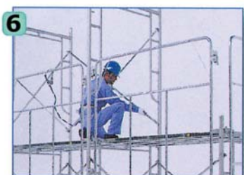
2層目の建わくを組み立て、躯体側の足場に交さ筋かいを設置します。

固定金具はワンタッチで建わくに装着できます。しかも、手締めボルトにより、安全を高めるロックが可能です。