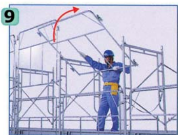
上下逆に仮置きしたライフガードの上方を持ち、手前に引きながらライフガードを180°反転させます。*

高所作業となる2層目以上の取付作業は床付き布わく中央部で仮置きしていきますので、足場からの乗り出しがなく、安全な作業が行えます。