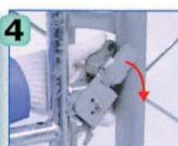
下部固定金具を固定します。