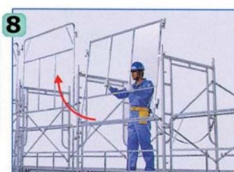
2層目の建わく横架材にライフガードを仮置きします。

ライフガードを上下逆にした状態で位置決め金具を建わくの横架材にかけます。*この時ライフガードの下部は、下層のライフガードの外になるようにします。