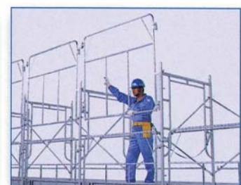
下部固定金具を手順45のように2層目の建わく脚柱に固定します。