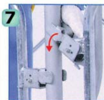
1層目のライフガードの上部固定金具を2層目の建わく脚柱に固定します。