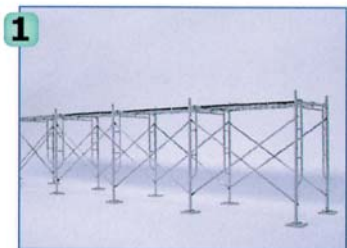
1 層目のわく組足場を組み立てます。(1層目のみ両面に交さ筋かいを取付けます。)

アルインコ独自の回転施工方式*により、足場からの乗り出しがなく、安全な設置、解体が行えます。しかも、外側面には交さ筋かいを設置する必要がない上、ワンタッチ取付金具により工具も不要!!。スピーディな設置・解体が行えます。*狭小な場所などで回転不可能な場合は、通常施工方式によって取付けることも可能です。