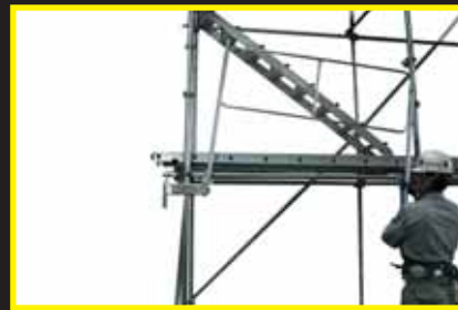
下部ピン付支柱側からソケットに取付けます。