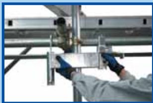
手すり固定金具(表面)