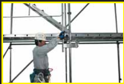
反対側支柱を持ち上げ固定金具ソケットに差込みます。