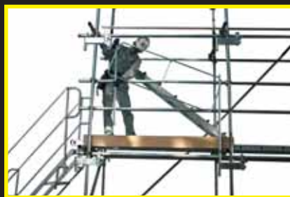
クサビ解除後支柱を抜き上層の金具に取付けます。