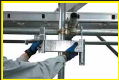
手摺固定金具を単管水平材に取付けます。