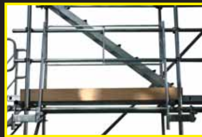
二段手摺、つま先板を移動前に組立ます。