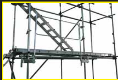
1層目のセット完了です。