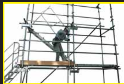
反対側の支柱も抜き取ります。