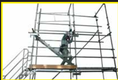
支柱を上層の固定金具に差込みます。