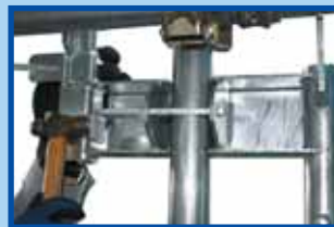
手すり固定金具(裏面)