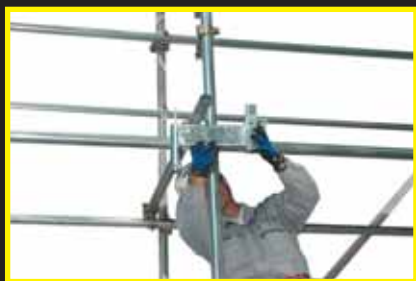
上層単管水平材に固定金具をセットします。