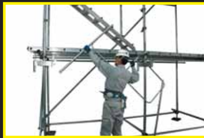
手摺ユニットを用意しセット準備します。