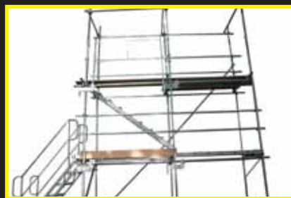
支柱下部のクサビを打ち込み盛り替え完了です。

*上記の組立手順は単管足場用先行型手すりの組立方を優先しています。単管足場の組立手順は「足場の組立等工事の作業指針」(建設業労働災害防止協会発行)の第5章 各種足場の組立、解体及び変更 5.2単管足場 5.2.5単管足場の組立、にしたがって作業してください。